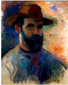
1 - Autoportrait , 1905 Huile sur toile 55 x 46 cm Collection particulière