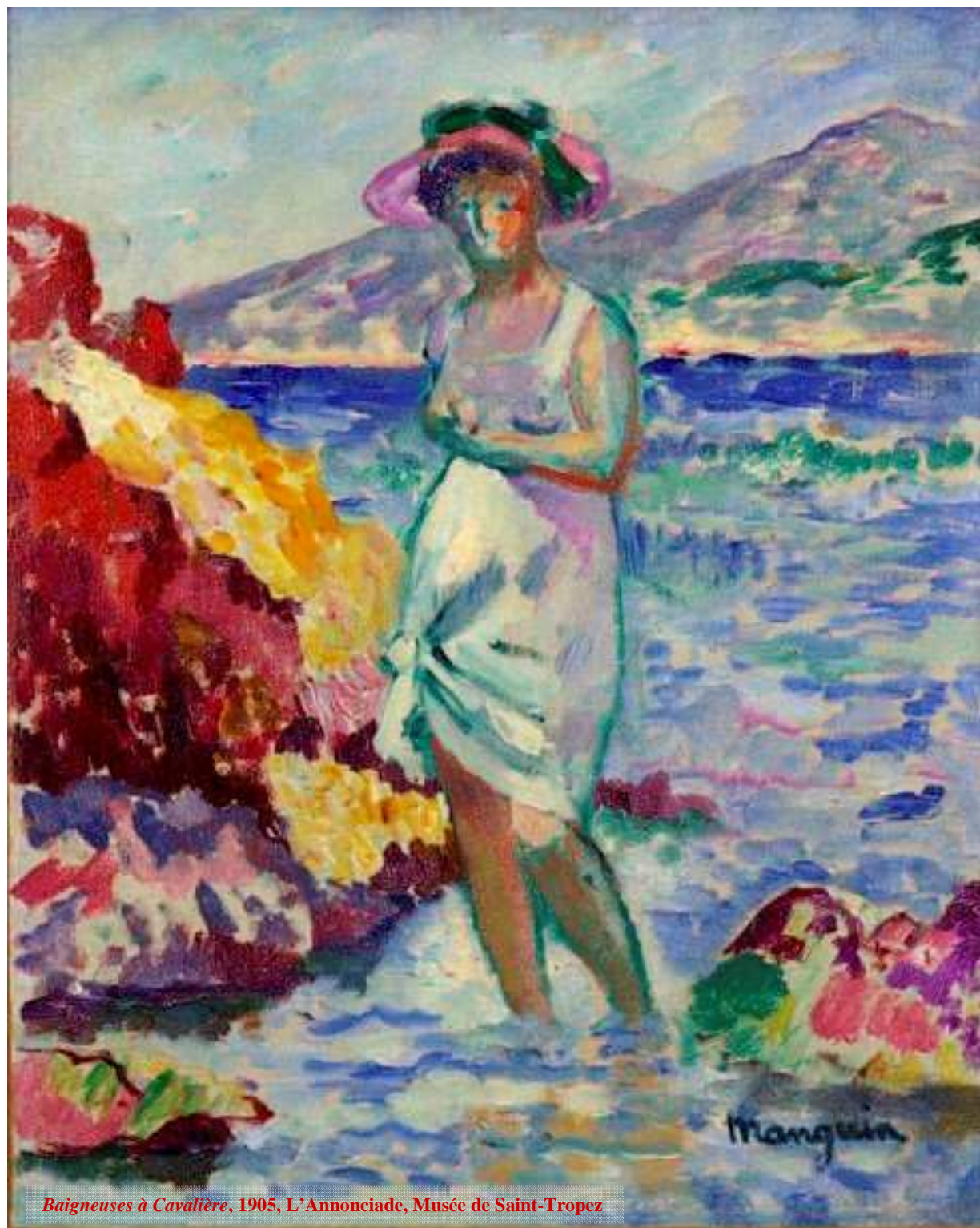
Baigneuses à Cavalière, 1905, L'Annonciade, Musée de Saint-Tropez