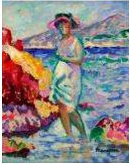
5 - Baigneuse à Cavalière, 1905 Huile sur toile 41 x 33 cm L'Annonciade, Musée de Saint-Tropez