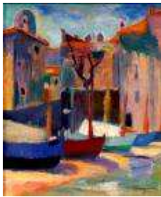
2 - Saint-Tropez, les bateaux à la Ponche , 1904 Huile sur toile 46 x 38 cm Collection particulière