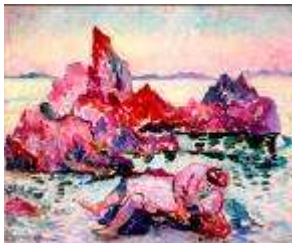
7 - Etude pour la naïade, 1906 Huile sur toile 35.5 x 48 cm Collection particulière