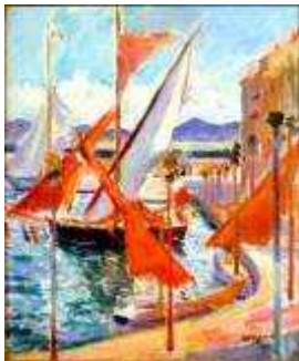
6 - Le 14 Juillet à Saint-Tropez, côté droit, 1905 Huile sur toile 61 x 50 cm Collection particulière