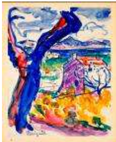
3 - Saint-Tropez, l'arbre et le golfe , 1904 Aquarelle 19.5 x 15.2 cm Collection particulière