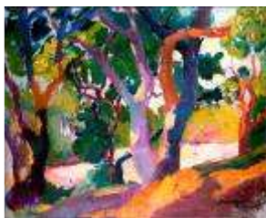
8 - Les petits chênes-lièges, 1906 Huile sur panneau 35 x 45 cm Collection particulière