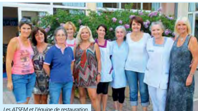
Les ATSEM et l'équipe de restauration.