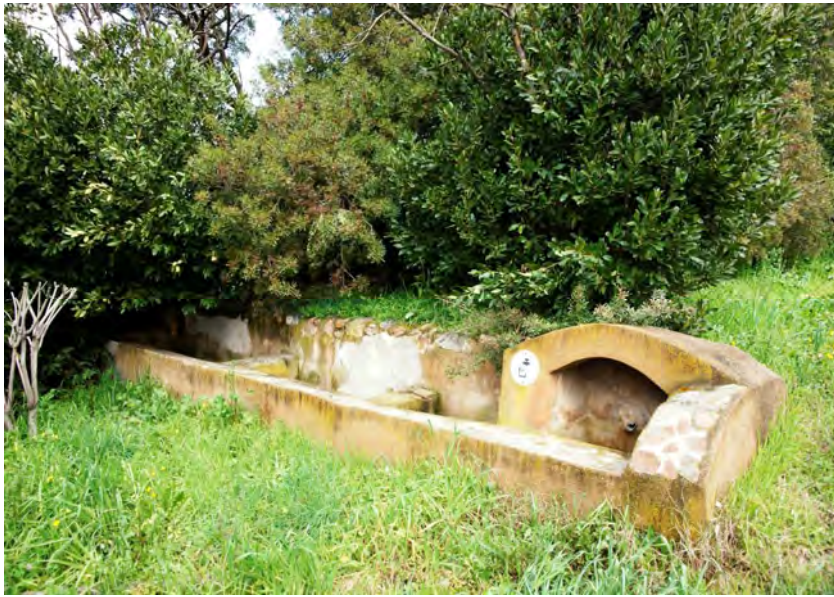
Entretien fontaine du Pin