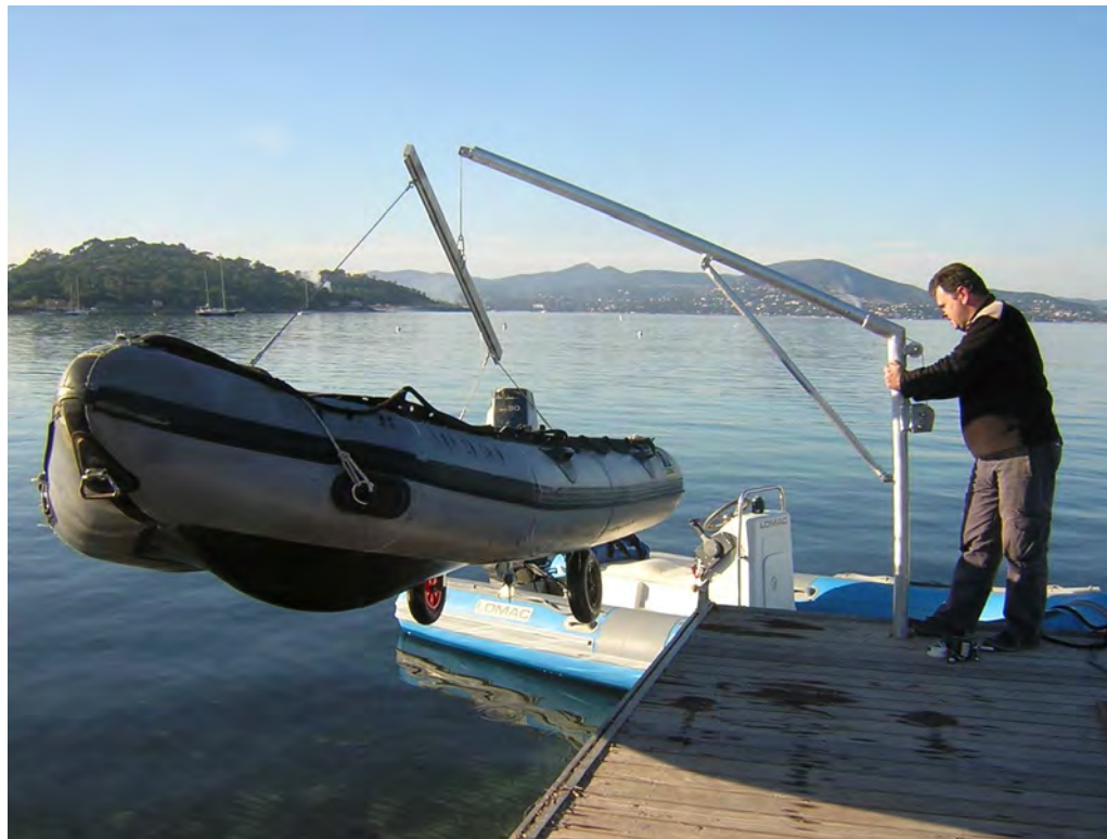
Bossoir Ecole de Voile