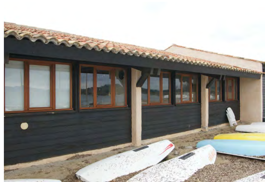
Boiseries Ecole de Voile