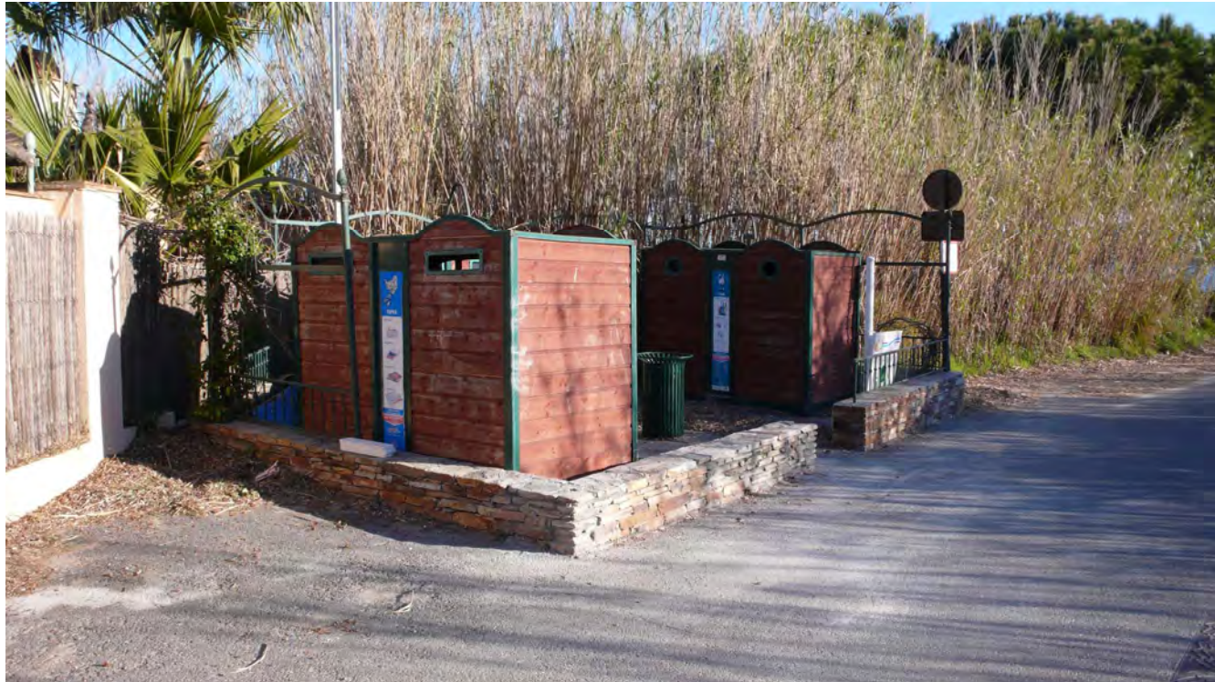
Réfection muret PAV Chemin de l'Estagnet