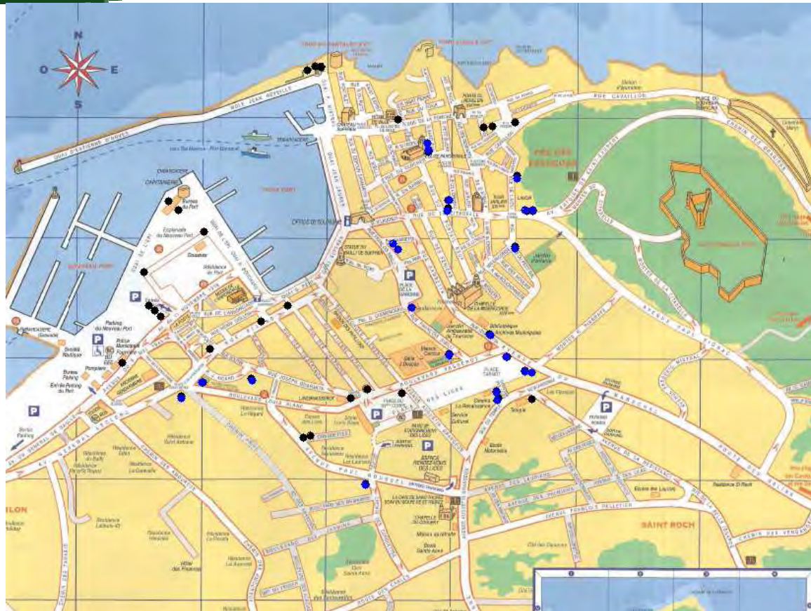
Emplacements containers en Ville