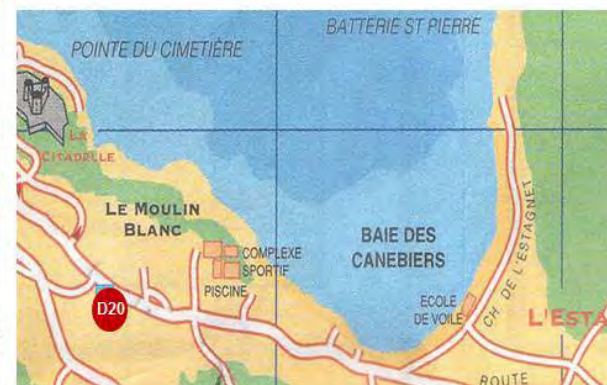
Collège du Moulin Blanc