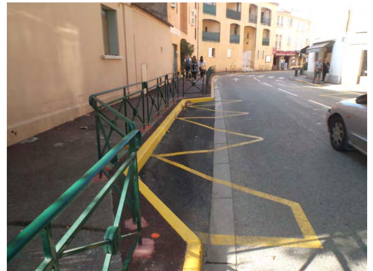
Boulevard Vasserot Boulevard Louis Blanc etc.