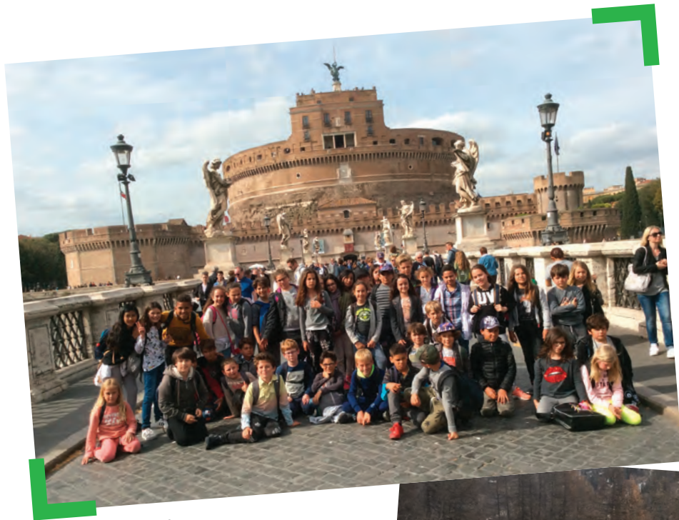
Voyage à Rome 2017

Le coût pour la Ville s'est élevé à 12 650 € au titre des classes de neige pour 55 enfants et 3639 € au titre du voyage scolaire à Rome pour deux classes et sorties diverses.