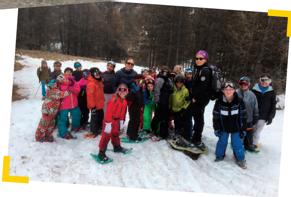
Séjour neige 2017

Le coût pour la Ville s'est élevé à 12 650 € au titre des classes de neige pour 55 enfants et 3639 € au titre du voyage scolaire à Rome pour deux classes et sorties diverses.