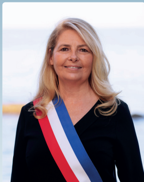
Sylvie SIRI MAIRE DE SAINT-TROPEZ, CONSEILLERE REGIONALE